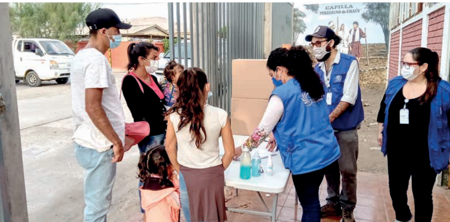
Familia migrante es acogida en Arica, frontera Chile y Perú