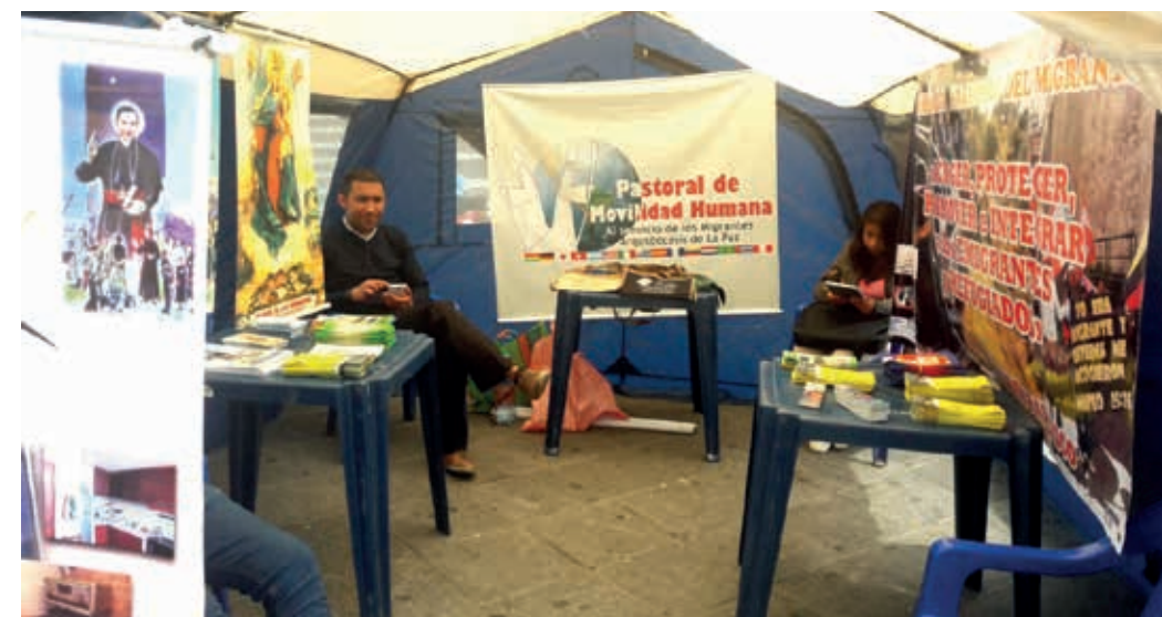
Tienda misionera mantenida por la Juventud PMH

Actualmente hay dos generaciones de jóvenes que siguen aportando de su creatividad y fuerza en las diferentes actividades, tales como: ferias institucionales de la PMH La Paz, las ferias gastronómicas y culturales y el servicio volun-