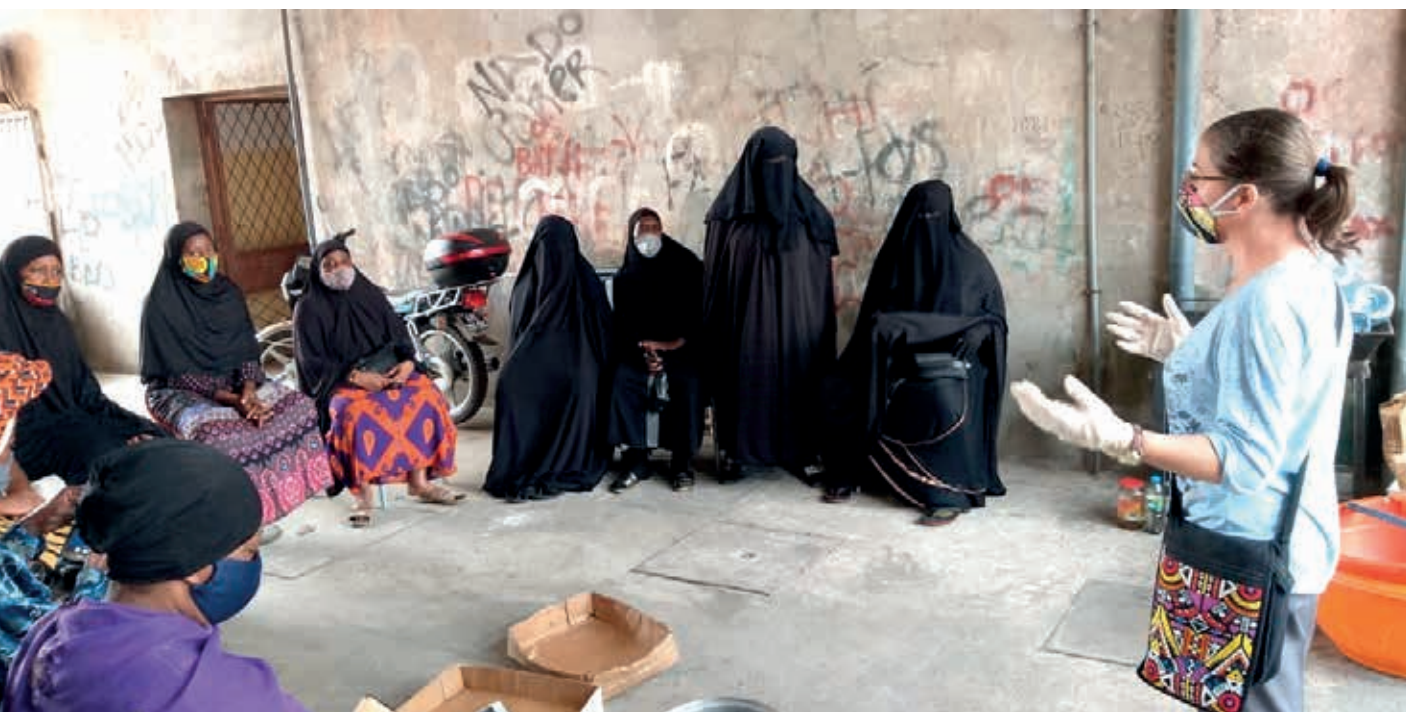
Oficina de sabão com a comunidade muçulmana em Luanda