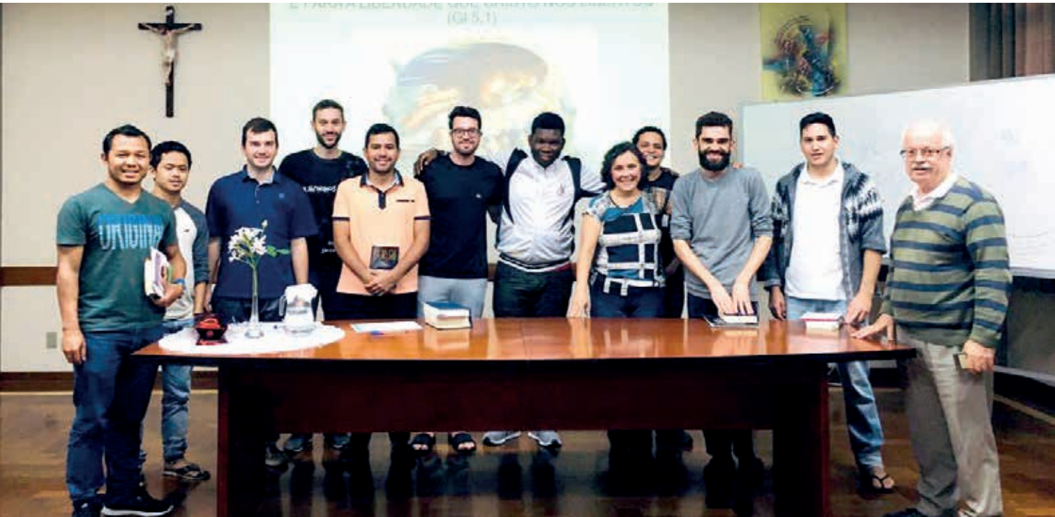
Religiosos Scalabrinianos de la etapa de la teología en San Pablo