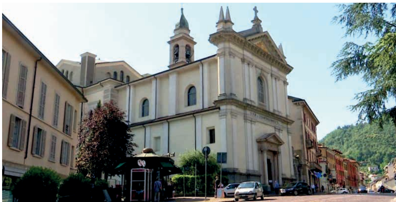
Igreja de São Bartolomeu onde João Batista Scalabrini foi pároco