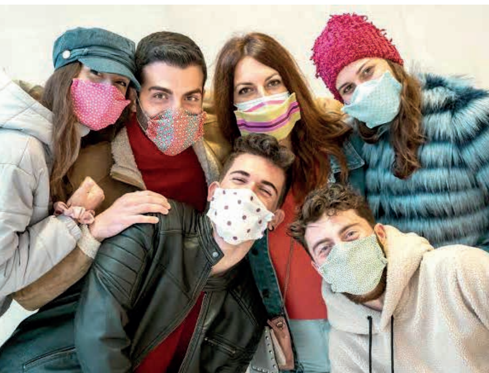
Jóvens compartiendo amistad

♦ Por P. Camilo Moreira Maforde, cs (adaptado de la Revista de Educación Religiosa)