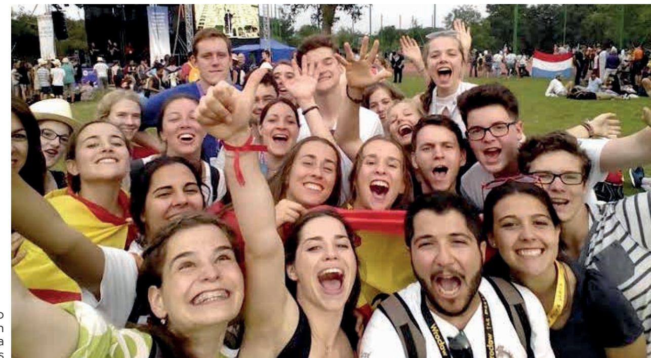
Evento masivo con la presencia de jóvenes

Diante da situação de pandemia e confinamento, surge a pergunta: será que os elementos do mundo pandêmico permanecerão no mundo pós-pandêmico? A resposta está no cultivo da fé, da espiritualidade e da esperança, no retorno aos encontros sem deixar de usar as plataformas virtuais e a comunicação digital.