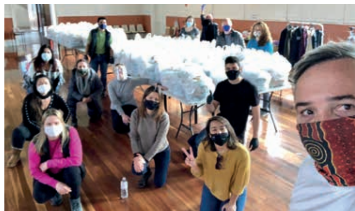
Jovens voluntários no projeto solidário

Porém, com o passar do tempo, as necessidades se multiplicaram. Impulsionados pelo pedido da comunidade brasileira em Melbourne, no início de maio de 2020, apresentamos um grande projeto que envolveu diferentes grupos, tendo um mesmo objetivo: “dar um pouco de ajuda para quem precisa em tempos de pandemia, aos estudantes internacionais, aos