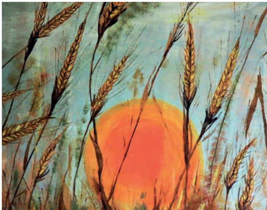
Sol que representa a Jesús crucificado y resucitado, el grano que muere para recibir vida nueva