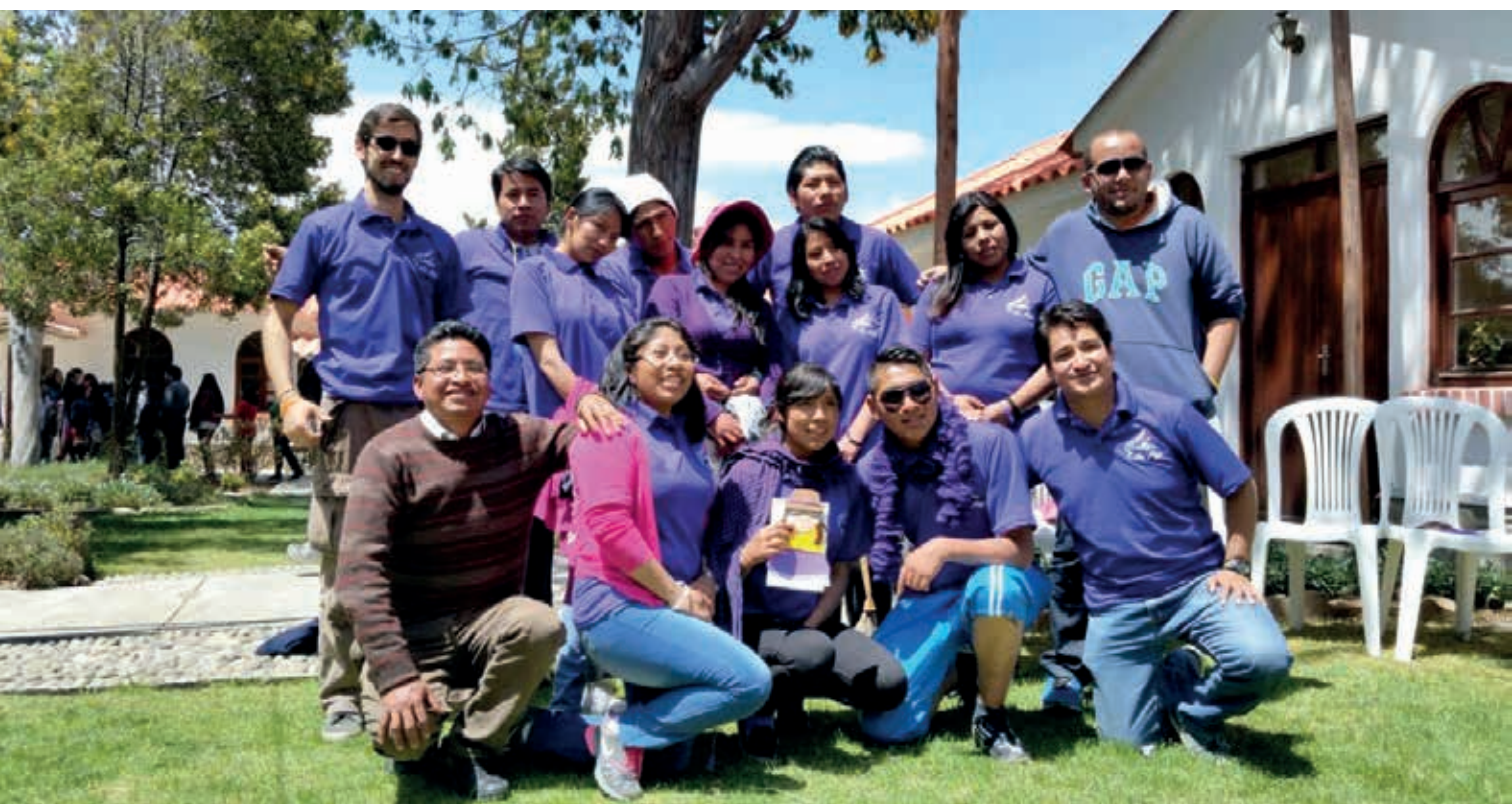
Juventud PMH en mision