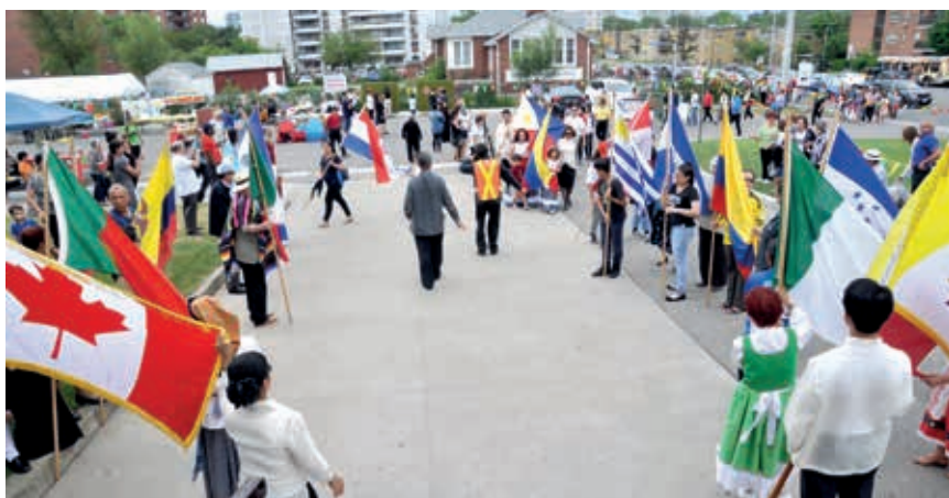
Festa da padroeira