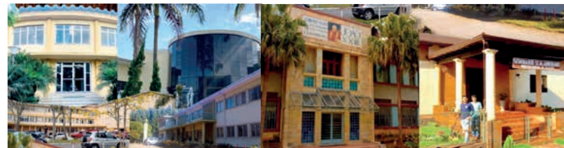
Seminarios de la Región Nuestra Señora Madre de los Migrantes

Para aqueles que querem seguir sua vocação à vida religiosa através do sacerdócio na Congregação Scalabriniana, se faz necessário um processo formativo contemplando algumas etapas específicas, para se preparar na prática apostólica aos migrantes.