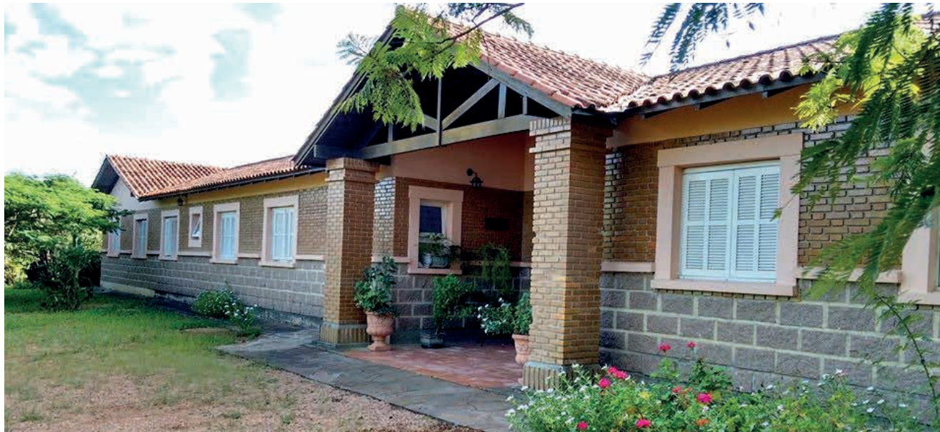
Casa do Migrante Guadalupe