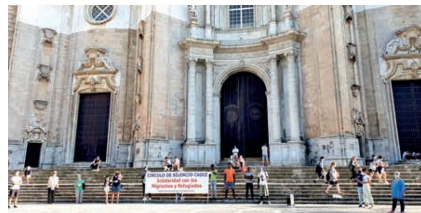
Participación al círculo de silencio en Cádiz