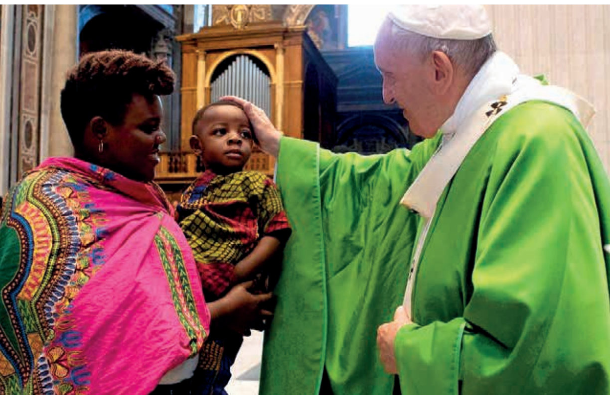
Papa Francisco abençoa mãe migrante com seu filho