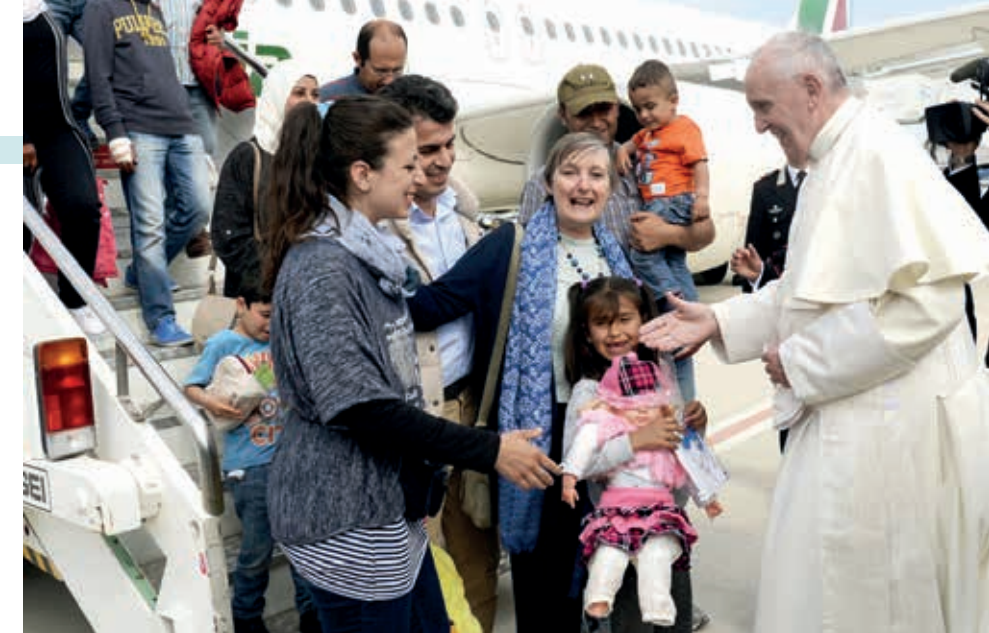
Papa Francisco com migrantes muçulmanos em Lesbos

Por que tanta gente é forçada a migrar? As causas são múltiplas, complexas e entrecruzadas. Prevalcem os fatores de ordem socioeconômica, como pobreza, miséria e fome; mas eles se mesclam a decisões pessoais e familiares. De outro