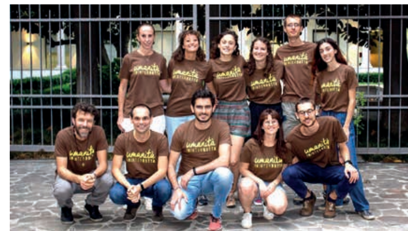
Equipo del Proyecto Umanità InInterRotta

Para reconocer es necesario ver de cerca. Reconocimiento indica conocimiento nuevo sobre algo o alguien. El reconocimiento ge-