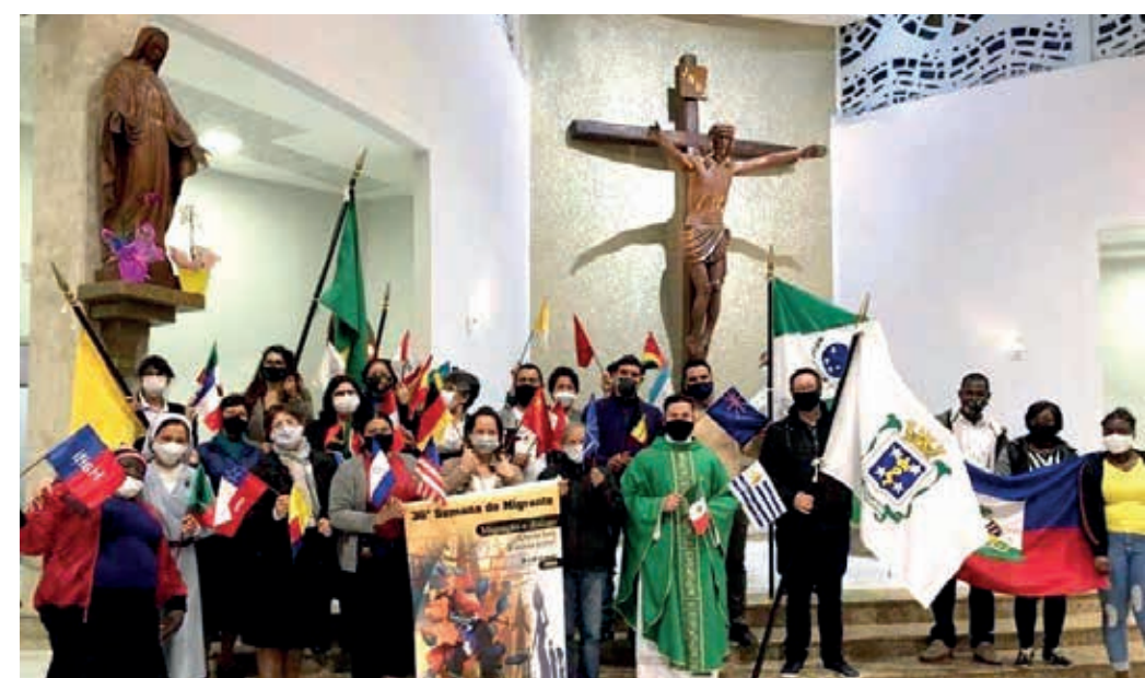
P. Jesus celebrando la misa del migrante en Cascavel, PR

La defino como una señal de esperanza para muchos migrantes que llegan a los diferentes países y una oportu-