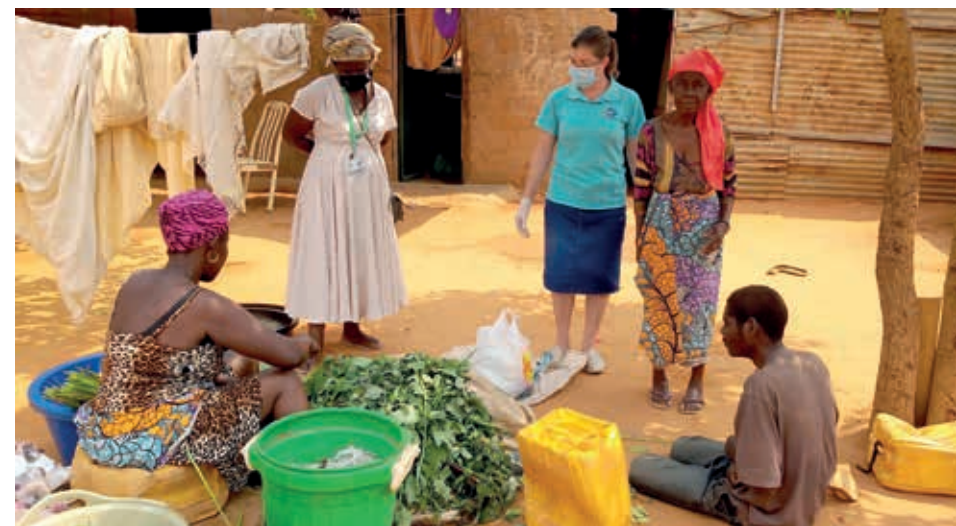
Visitas aos refugiados e entrega de alimentos e medicamentos na Diocese de Viana

La presencia de las Misioneras Scalabrinianas en Angola comenzó en el año 2000. Desde entonces se hace el trabajo con los migrantes, promoviendo una cultura de acogida y ejecutando proyectos asistenciales, sociales y formativos. Este trabajo se intensificó aún más con la creación, en 2006, con el apoyo de la Conferencia de los Obispos, la Comisión Episcopal de la Pastoral para los Migrantes e Itinerantes de Angola y Santo Tomé – CEPAMI.